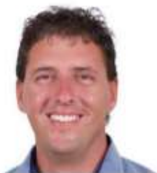
Gernot Kremsner Bürgermeister

Wir sind zuversichtlich, dass es durch dieses gemeinsam erarbeitete Zukunftsprofil und die in der Gemeinde Rohr vorherrschende Sachpolitik gelingt, überparteilich, sowie im Einklang mit unserer Bevölkerung an einem Strang zu ziehen und Rohr weiter zu entwickeln.